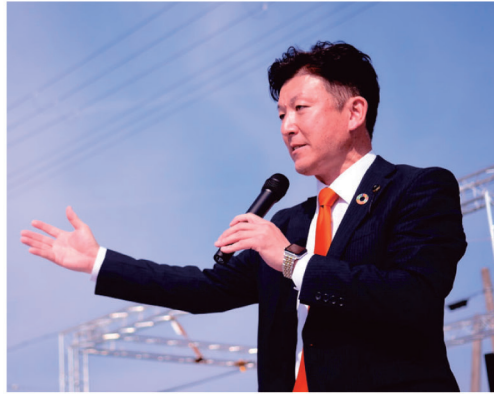
▲滋賀県議会議員 田中松太郎 様