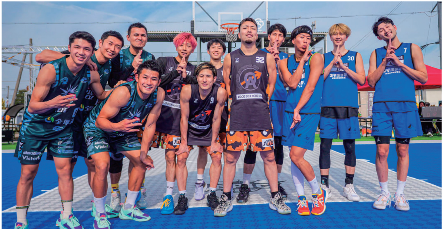
▲左からEPIC、ORANGE ARROWS、NINJA AIRS

午後からは、甲賀市水口でダンススタジオを運営されているBOUNCE BACK 様によるダンスパフォーマンスからスタート!世界大会にも出場された最高のダンスパフォーマンスで、会場を盛り上げてくださいました!!